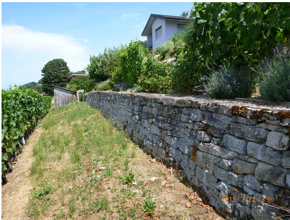
Photos de l'objet 22.07.2015